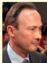
Bruno Valkeniers Vlaams Belang-voorzitter

“Een kordate aanpak van de criminaliteit blijft uit. Tot ergernis van de rechters, tot frustratie van de politie, tot onvrede van de samenleving en tot groot jolijt van de criminelen.