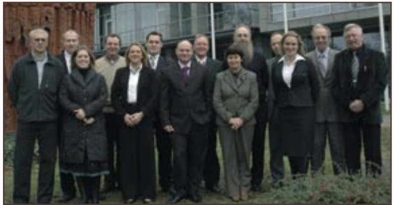
De vertegenwoordiging van het Vlaams Belang in de West-Vlaamse provincieraad.