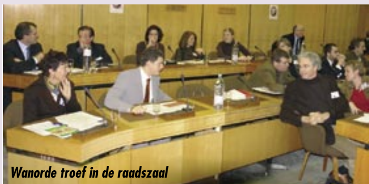
Wanorde troef in de raadszaal