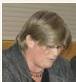
Schepencollege moet OCMW-voorzitster niet

De superdemocraten van de Kortrijkse SPA-Spirit-Groen!-oppositie zaten erbij, keken ernaar, molenwiekten en stemden met de meerderheid mee. Zij, die zichzelf zo graag progressief noemen,